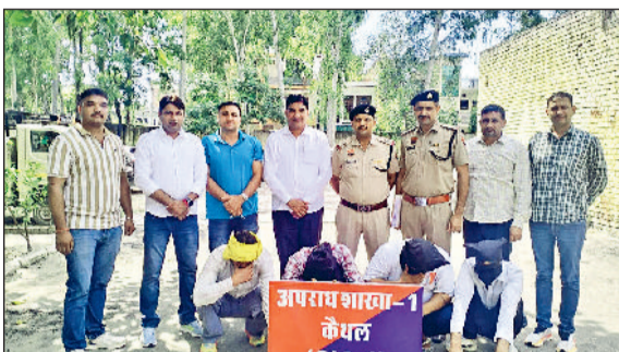
कैथल। सीआईए वन पुलिस की गिरफ्त में चार सूदखोर