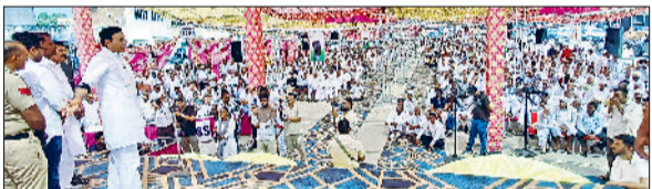
रणदीप सुरजेवाला गुर्जर डांड में न्याय अधिकार सम्मेलन को संबोधित करते हुए।