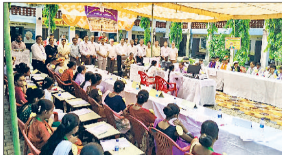
कैथल। चौशाला के राजकीय स्कूल में चल रही जिला स्तरीय युवा संसद प्रतियोगिता।