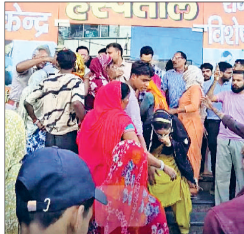
जींद। अस्पताल के बाहर रोष व्यक्त करते हुए परिजनों को समझाते हुए पुलिस अधिकारी।

परिजनों के विफरने की सूचना मिलने पर शहर थाना सफ़ीदों प्रभारी तथा सदर थाना प्रभारी पुलिसबल के साथ मौके पर पहुंच गए और कार्रवाई का आश्वासन देकर जच्चा-बच्चा के शव का नागरिक अस्पताल पहुंचाया।